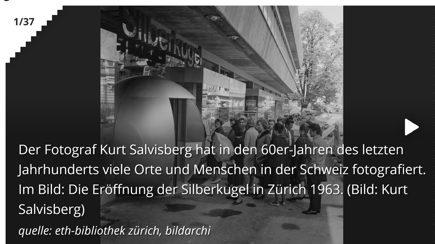
Der Fotograf Kurt Salvisberg hat in den 60er-Jahren des letzten Jahrhunderts viele Orte und Menschen in der Schweiz fotografiert. Im Bild: Die Eröffnung der Silberkugel in Zürich 1963.