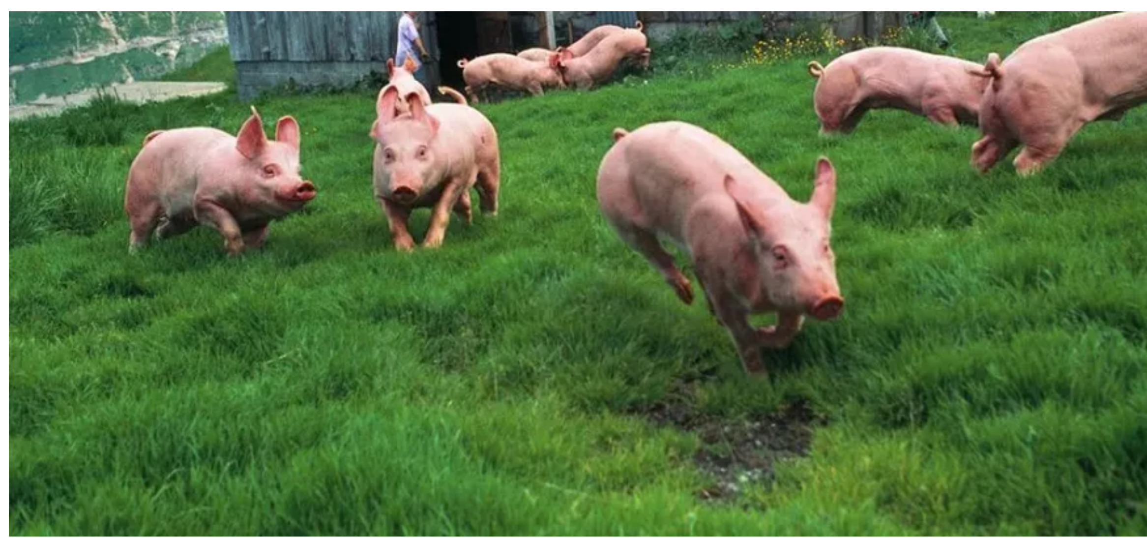
Das ist nur ein Symbolbild, diesen Tieren gehts gut und die abgebildeten Menschen haben nichts verbochen.

Mitte September verhandelte das Bezirksgericht Weinfelden einen Fall von mehrfacher Tierquälerei. Dahinter steckt indes ein Ereignis von mehrfacher sexueller Handlungen mit Tieren. Ein Thurgauer Bauer und sein 30-jähriger Sohn mussten im Gerichtssaal im Weinfelder Rathaus antraben. Der Vater sitzt hauptsächlich als offizieller Tierhalter auf der Anklagebank. Die Taten begangen hat sein Sohn.