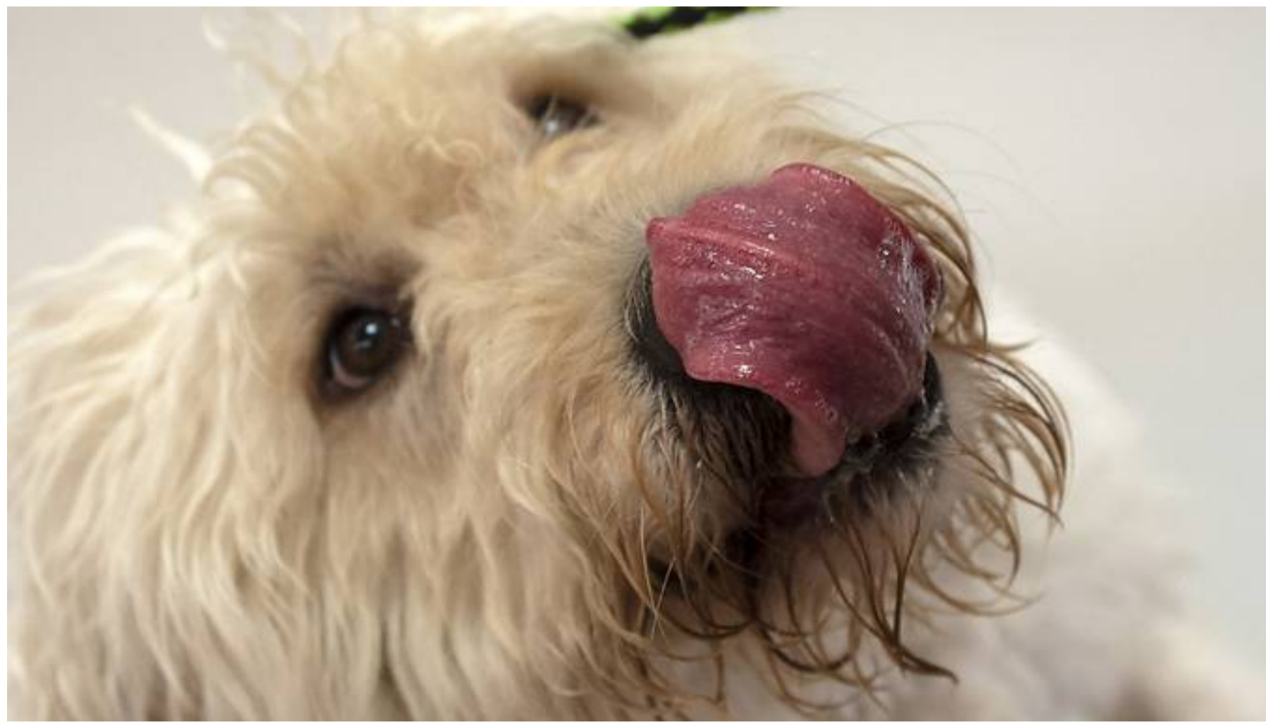
Pro 10 000 Menschen in der Schweiz werden rund 2 Verfahren wegen Tierrechtsmissbrauch geführt. (Symbolbild)

Im vergangenen Jahr sind in der Schweiz 1760 Straftaten gegen Tiere juristisch behandelt worden. Die Stiftung für das Tier im Recht geht jedoch von einer hohen Dunkelziffer aus und fordert griffigere kantonale Strukturen und eine bessere Ausbildung der involvierten Instanzen.